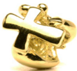
Glaube, Liebe, Hoffnung