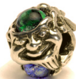
Trolle aus Glas

Jetzt Infomappe anfordern und Trollbeads-Händler werden!